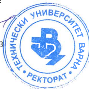
ПРОФ. ДН ИНЖ. РОСЕН ВАСИЛЕВ РЕКТОР НА ТУ - ВАРНА