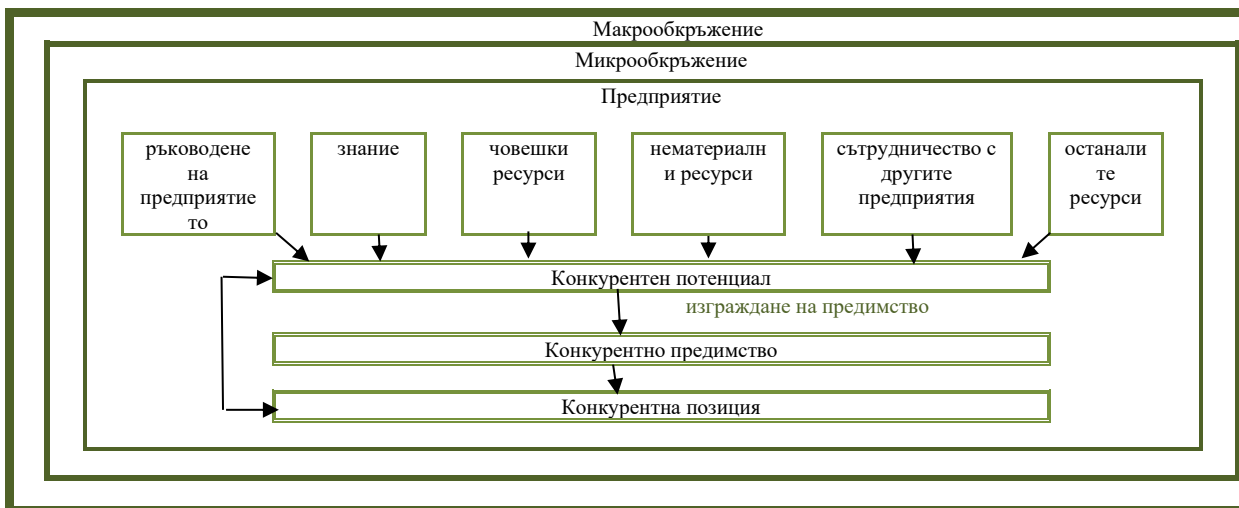
Диаграма 3.4 Авторски модел на конкурентоспособността на МСП