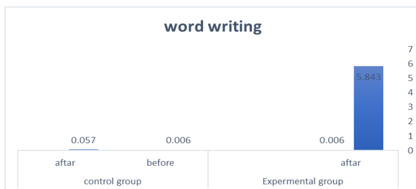
Figure 15: Grades of achievement in emergent literacy - writing word before the intervention program and after according to the group's type

В обобщен вид резултатите са представени на фигура 15: