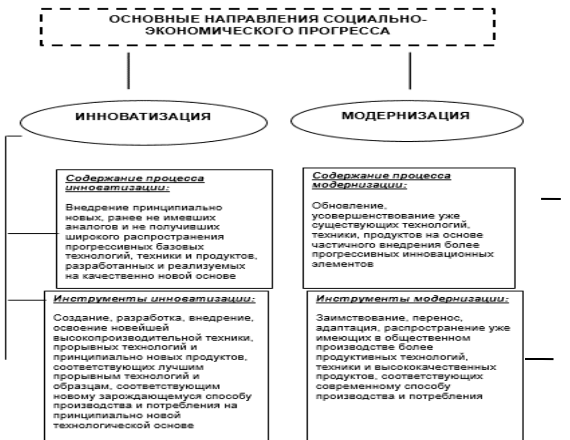
Фиг. 1. Съдържание на понятията иноватизация и модернизация.

Природните условия са предопределящи направления в стратегията на иноватизация на социално-икономическото развитие и нейните особености, това е свързано с малката им променливост. Икономическите условия за развитие на регионалната икономика се променят сравнително по-бързо, което често оказва решаващо въздействие върху особеностите на формиране на регионалните стратегии за иноватизация, включително направленията в нивото и характера на иноватизацията при използването на природните ресурси.