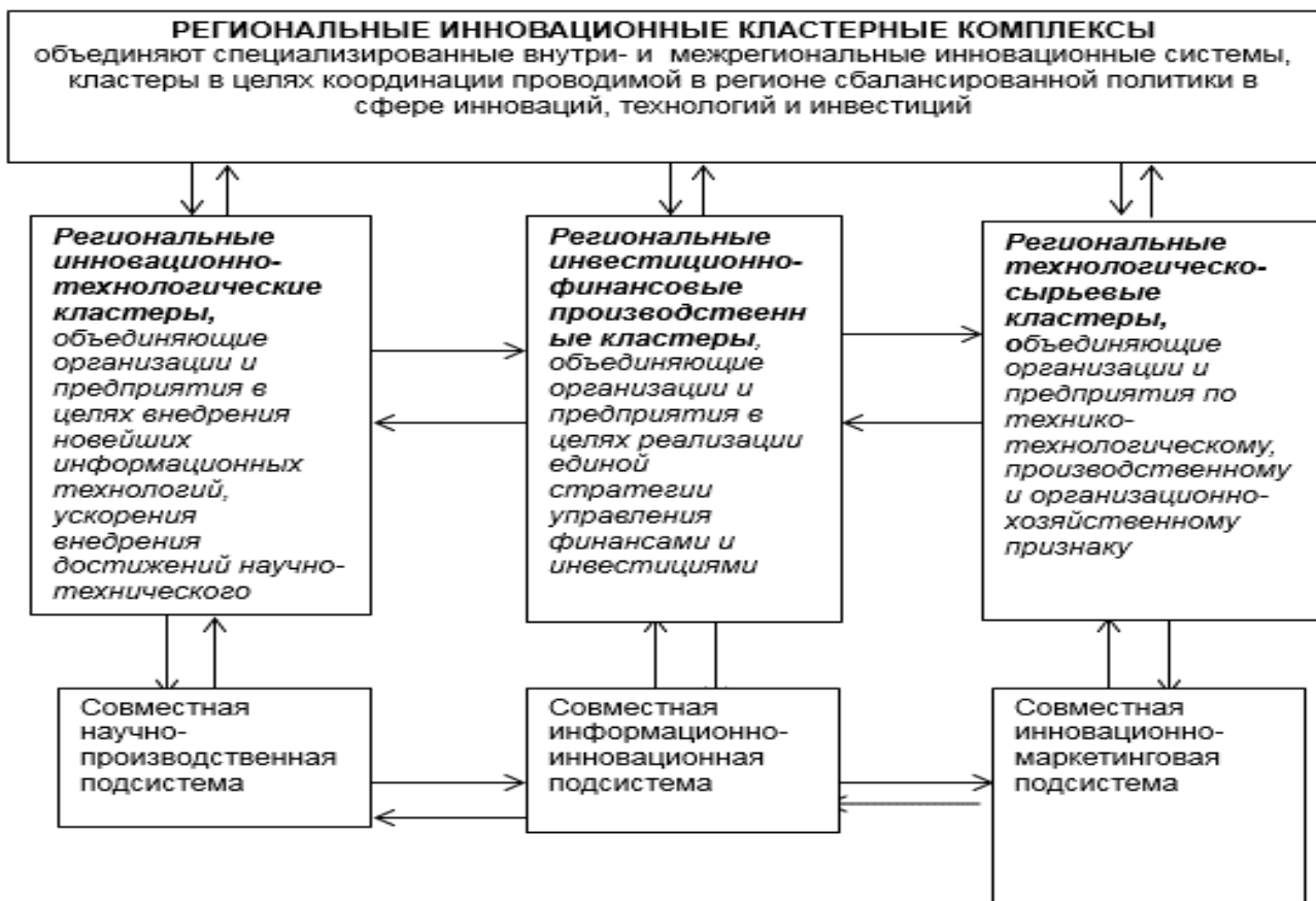
Фиг. 2. Съдържание и функции на регионалните кълъстерни комплекси в постиндустриалната икономика 1

Приоритетните роли при практическата реализация на стратегията за иноватизация на регионалното социално-икономическо развитие трябва да принадлежат на комплексните целеви програми за развитие на венчърните предприятия, малките иновационни предприятия, научно-производствените консултационни фирми и организации, стартъпите, развитието на мрежата на научно-производствените обединения, иновационните системи и подсистеми, иновационно-производствените кълъстери, венчърните предприятия, малките иновационни предприятия и т.н. Друго принципно направление е обосновката на въпросите за материално-техническото и кадровото обезпечение. Иноватизацията на регионалното социално-икономическо развитие поставя принципно нови изисквания пред кадровото обезпечение на дейността на предприятията. Тази кадри трябва да имат знания, умения, навици, компетенции за владеене на най-новата техника и технологии.